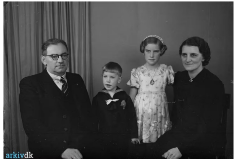
Billede fra Arkiv.dk B110993 fra 1941. Fotograf C. C. Tornøe, Ringe

En af historierne om den ældre mand fortælles, at han var rigtig god til at løbe på skøjter